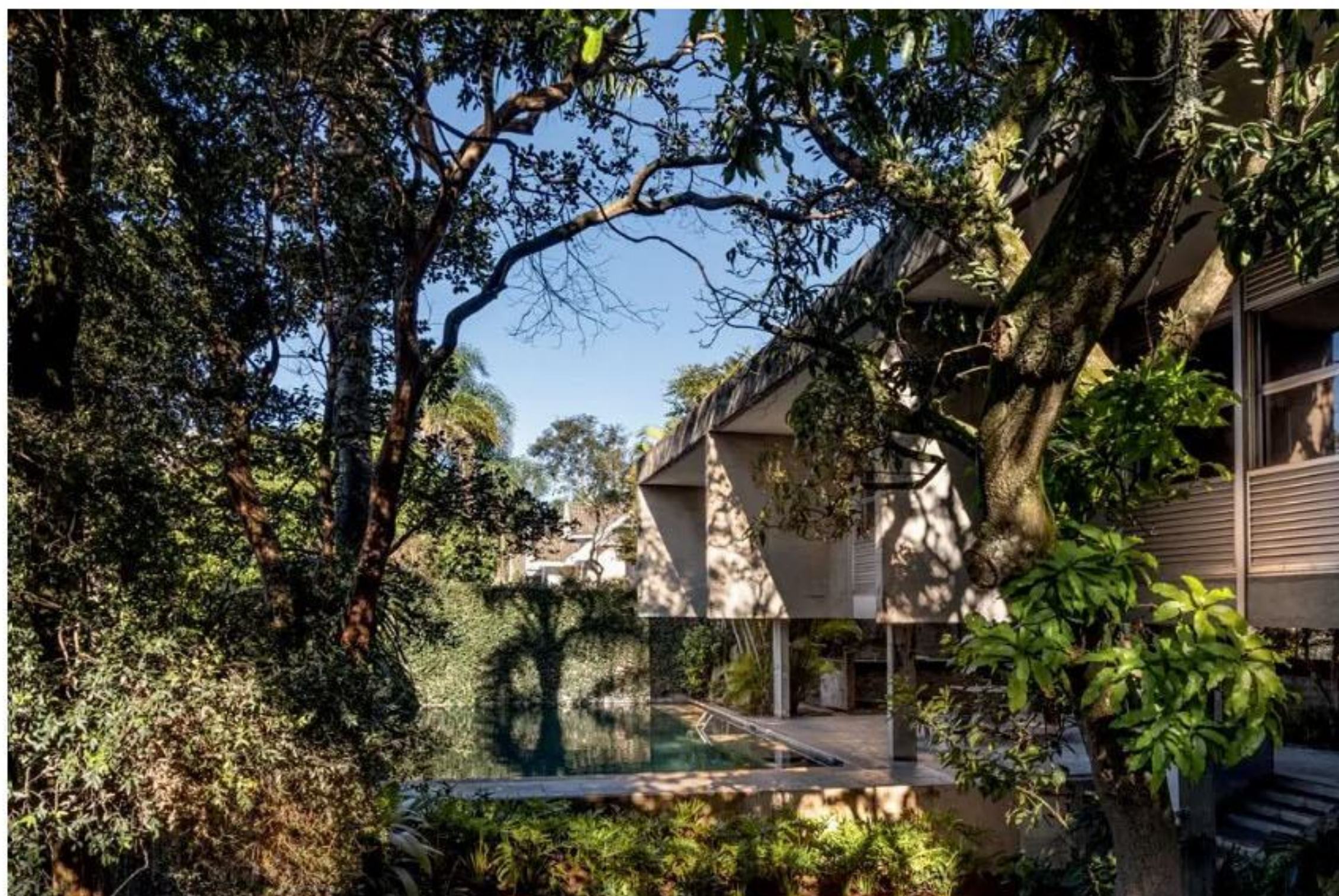
Casa projetada por Vilanova Artigas (1915-1985): sede da mostra 'Aberto 02'.

f Mais de 150 obras de setenta artistas em uma casa projetada por Vilanova Artigas (1915-1985) nunca antes aberta ao público.