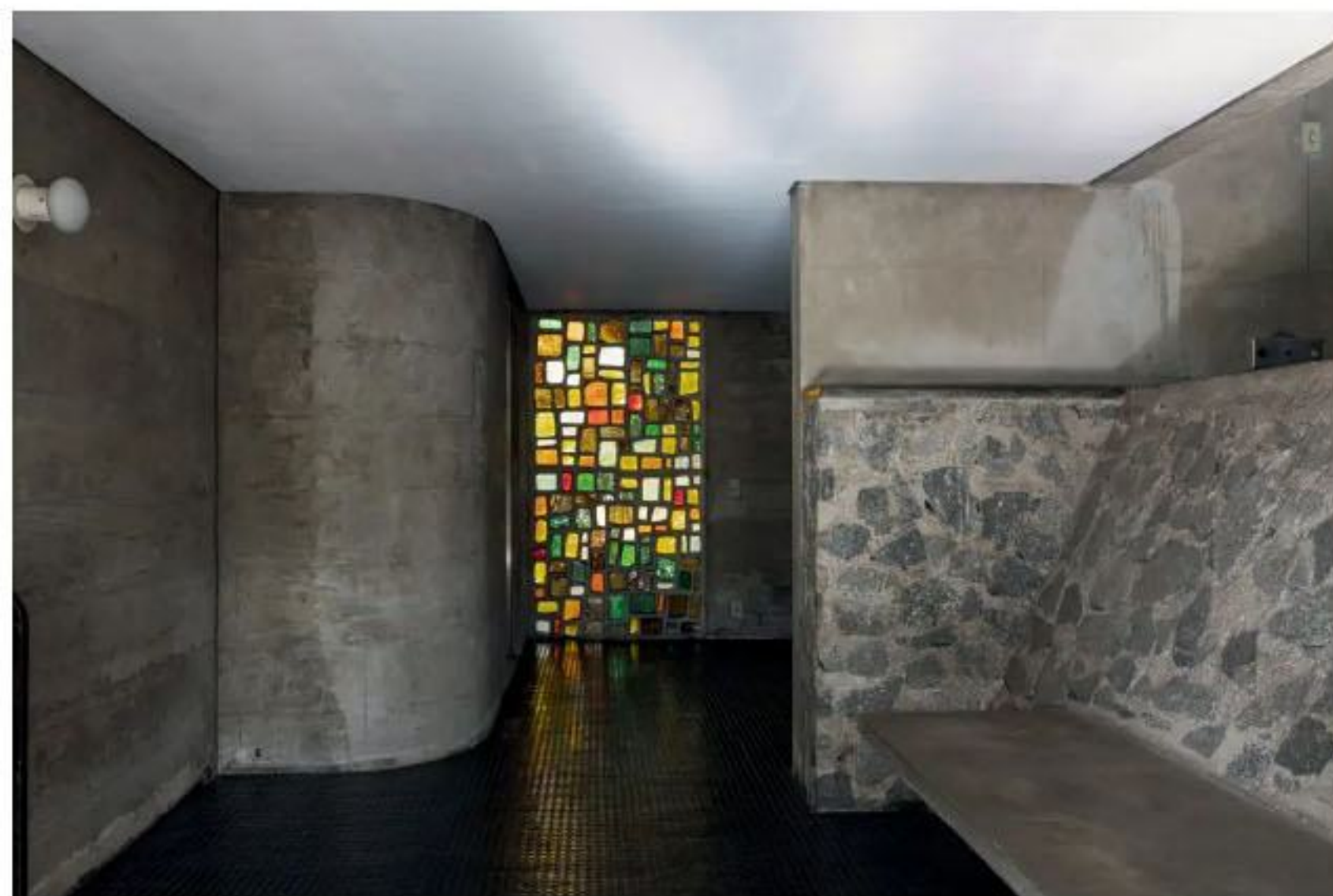
O interior da casa: arquitetura paulista.

Assim será a mostra Aberto 02 , que chega a sua segunda edição a partir do dia 13. Após a estreia, em 2022, na Casa Niemeyer , a exposição ocupa desta vez endereço no Alto da Boa Vista , desenhado em 1974 pelo arquiteto paranaense para o engenheiro Alfred Domschke e restaurado especialmente para o evento.