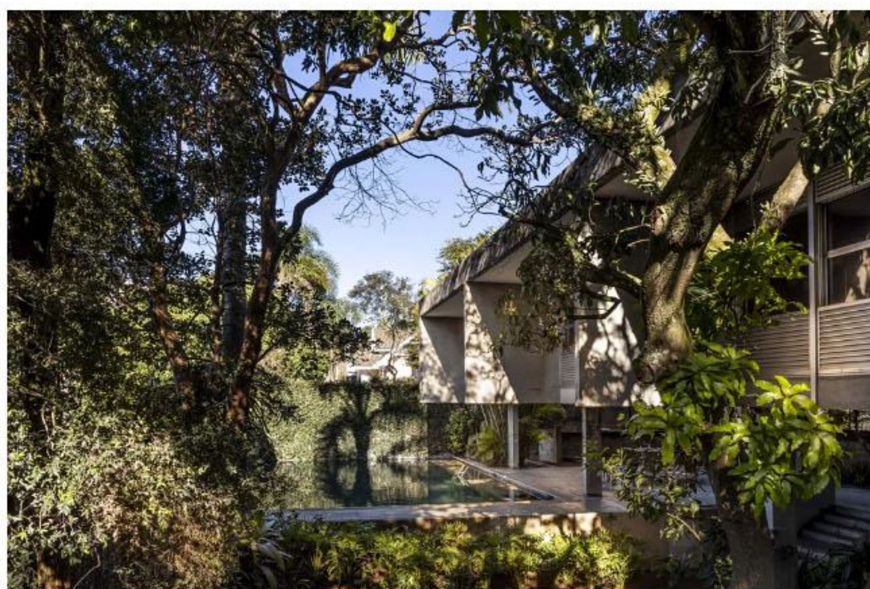
Casa assinada por Vilanova Artigas abre ao público pela 1ª vez com exposição em São Paulo