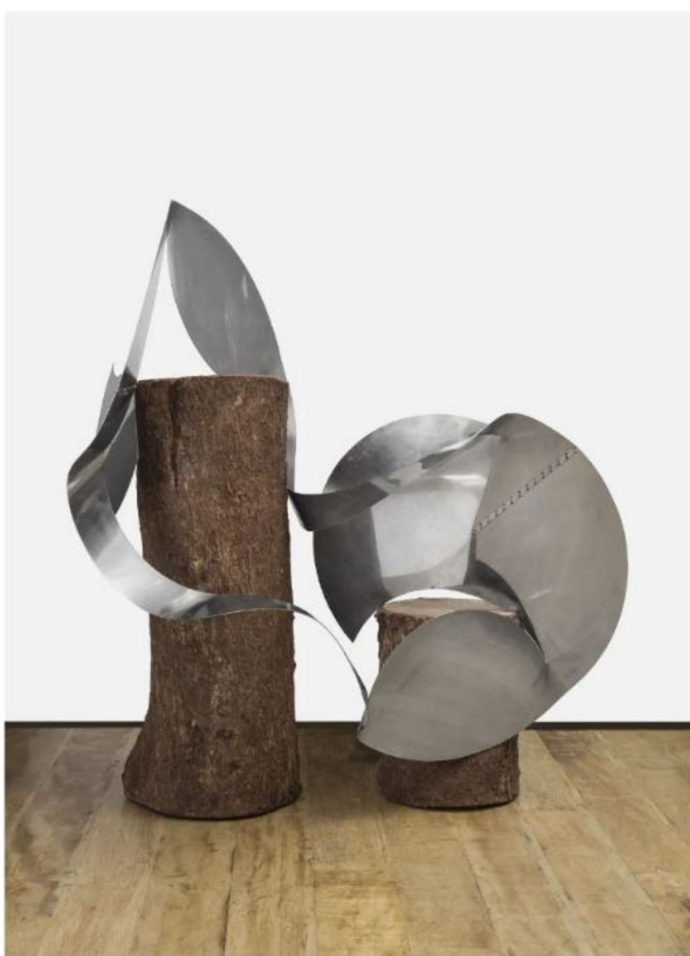
Trepante, de Lygia Clark