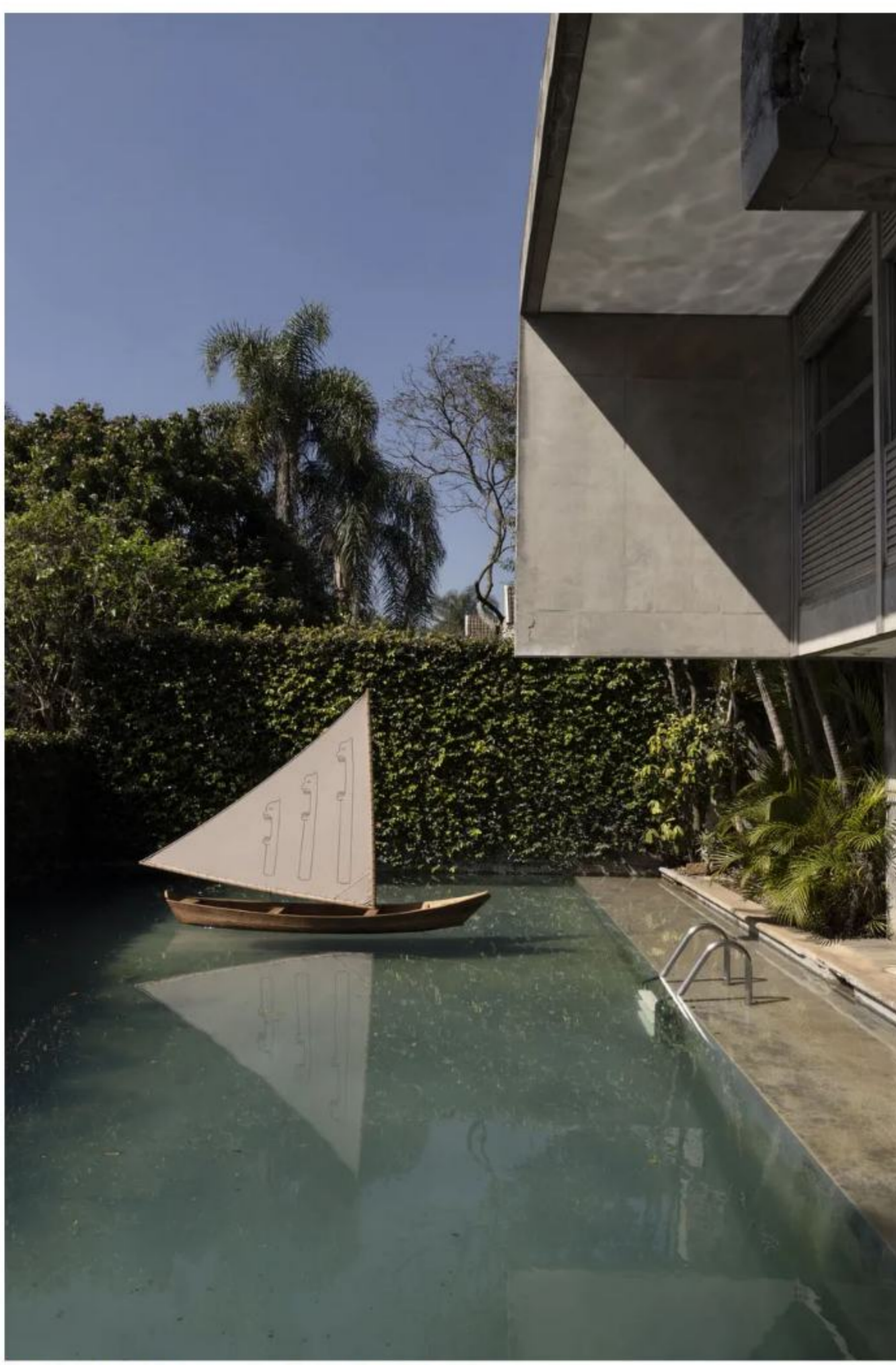
Obra de Davi de Jesus do Nascimento na Aberto 02