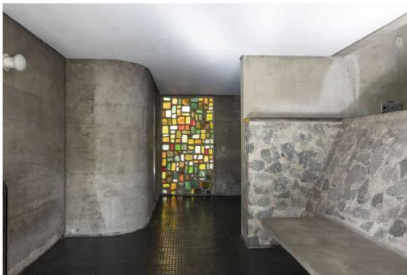
Aberto 02