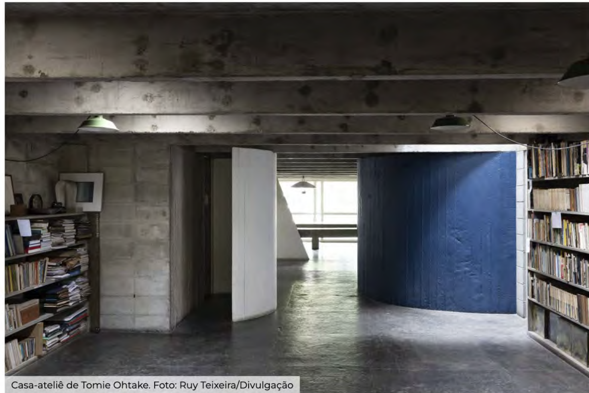
Casa-ateliê de Tomie Ohtake.

O espaço também traz o ateliê praticamente intocado da artista , que se mostra aos olhos do público pela primeira vez.